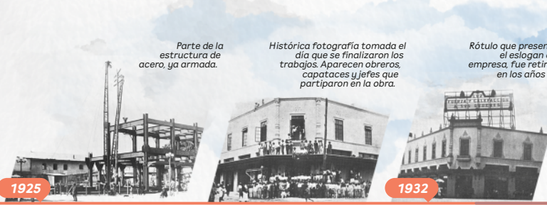
Edificio Administrativo EEGSA "Mole Asísmica": Diseñado por Bond & Share Co. y construido por Phoenix Utility Co., este edificio antisísmico de acero, fue levantado entre 1924 y 1925 con un equipo de 120 hombres. Con un área de 2,200 m 2 , fue inaugurado el 30 de noviembre de 1925. Aunque sin un estilo arquitectónico definido, sus entrepisos, techos y paredes de concreto están reforzados con 1,800 toneladas de acero. Dado que no había suministro de concreto en el país, se importaron una mezcladora y una grúa para manejar las pesadas vigas de acero. Ubicado en el corazón de la capital, el edificio ha sido testigo de 99 años de historia guatemalteca.

En 2022, EEGSA implementó el "Cable Bypass", una solución innovadora para mantener el servicio eléctrico sin interrupciones durante los mantenimientos de la red de distribución. Este avance refleja el compromiso de EEGSA con la mejora continua y la calidad del servicio, buscando siempre minimizar cualquier inconveniente para sus usuarios.